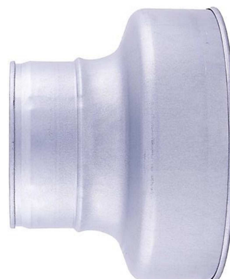
Rys. 2. Widok redukcji tłoczonyj żeńskiej.